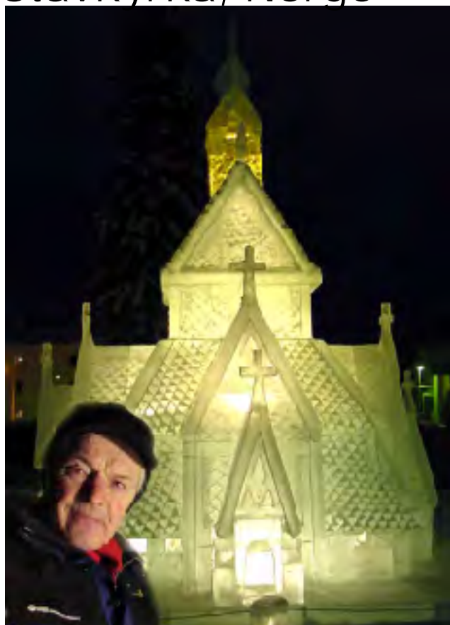
2003 Borgunds stavkyrka, Norge