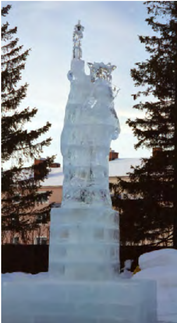
1996 Frihetsgudinnan, New York