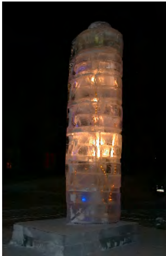
2006 Turning Torso, Malmö